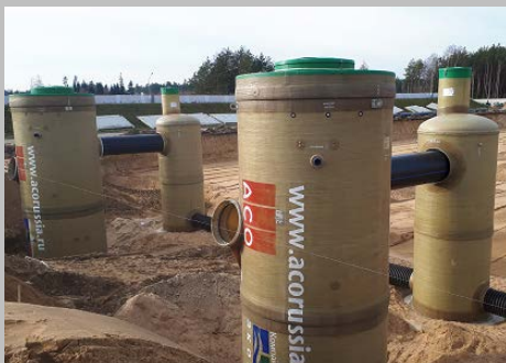
Индустриальный парк "Великий камень" "Оборудование для очистки поверхностного стока в составе ЛОС накопительного типа с самым большим в мире безбетонным аккумулярующим резервуаром АСО StormBrixx, Минск, Республика Беларусь